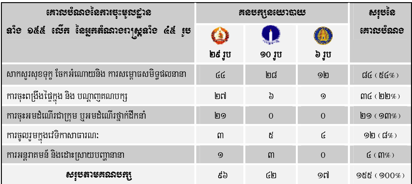
តារាងទី១: ចំនួនលើកនៃការចុះមូលដ្ឋានរបស់អ្នកតំណាងរាស្ត្រតាមគោលបំណងផ្សេងៗដែលខុមហ្វ្រែលទទួលបាន

ចំណែកតំណាងរាស្ត្រ គណបក្ស សមរង្ស៊ី យ៉ាងតិចចំនួន ១០ រូប (ស្មើនឹង ៤២% នៃអ្នកតំណាងរាស្ត្រគណបក្សនេះទាំងអស់ដែលមានចំនួន ២៤ រូប) បានចុះមូលដ្ឋានយ៉ាងតិចចំនួន ៤២ លើក (ឬជាមធ្យមអ្នកតំណាងរាស្ត្រគណបក្សនេះ ១ រូប ចុះមូលដ្ឋានបានចំនួន ៤ លើក) ហើយអ្នកតំណាងរាស្ត្រគណបក្ស ហ៊្វុនស៊ិនប៉ិច យ៉ាងតិចចំនួន ៦ រូប (ស្មើនឹង ២៣% នៃ អ្នកតំណាងរាស្ត្រគណបក្សនេះទាំងអស់ដែលមានចំនួន ២៦ រូប) បានចុះមូលដ្ឋានយ៉ាងតិចចំនួន ១៧លើក (ឬជាមធ្យមអ្នកតំណាងរាស្ត្រគណបក្សនេះ ១ រូប ចុះមូលដ្ឋានបាន ៣ លើក) ។